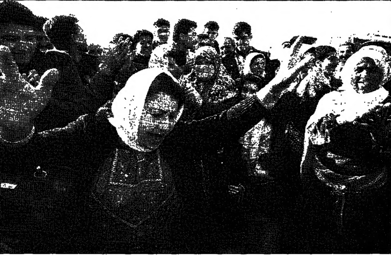
مئات المعتقلات الفلسطينيات يرضن أثناء انتظار إطلاق بناتهن من السجون الإسرائيلية (رويترز)

وزارة الدفاع الإسرائيلية - وقالت مصادر إسرائيلية إن سجناء فلسطينيين تم إطلاق سراحهم في أعقاب صفقة تبادل الأسرى مع إسرائيل. وقالت المصادر إن سجناء فلسطينيين تم إطلاق سراحهم في أعقاب صفقة تبادل الأسرى مع إسرائيل. وقالت المصادر إن سجناء فلسطينيين تم إطلاق سراحهم في أعقاب صفقة تبادل الأسرى مع إسرائيل.